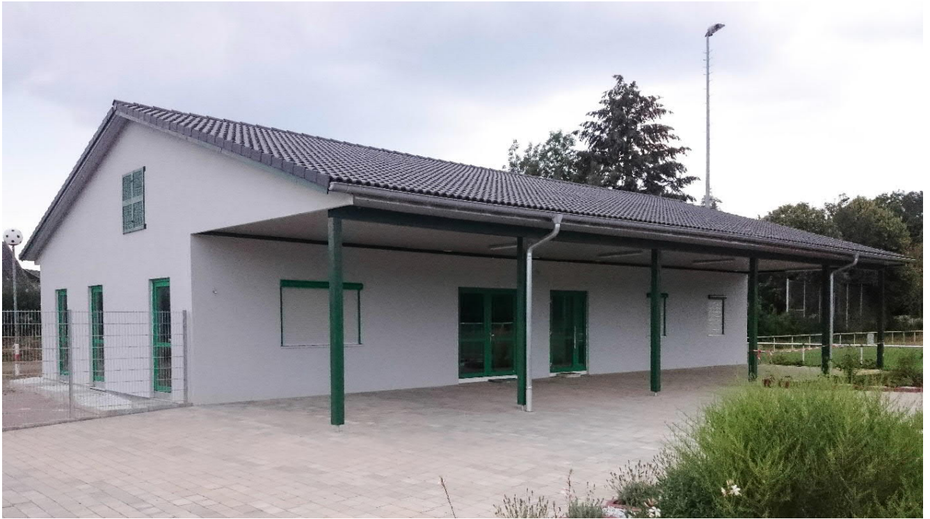
Neubau Jugendhaus / Mehrzweckgebäude